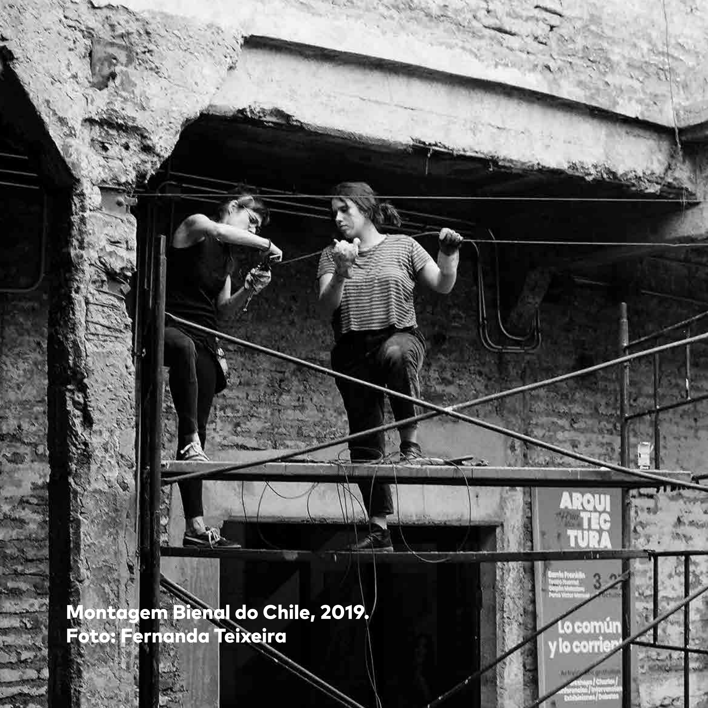
Montagem Bienal do Chile, 2019.