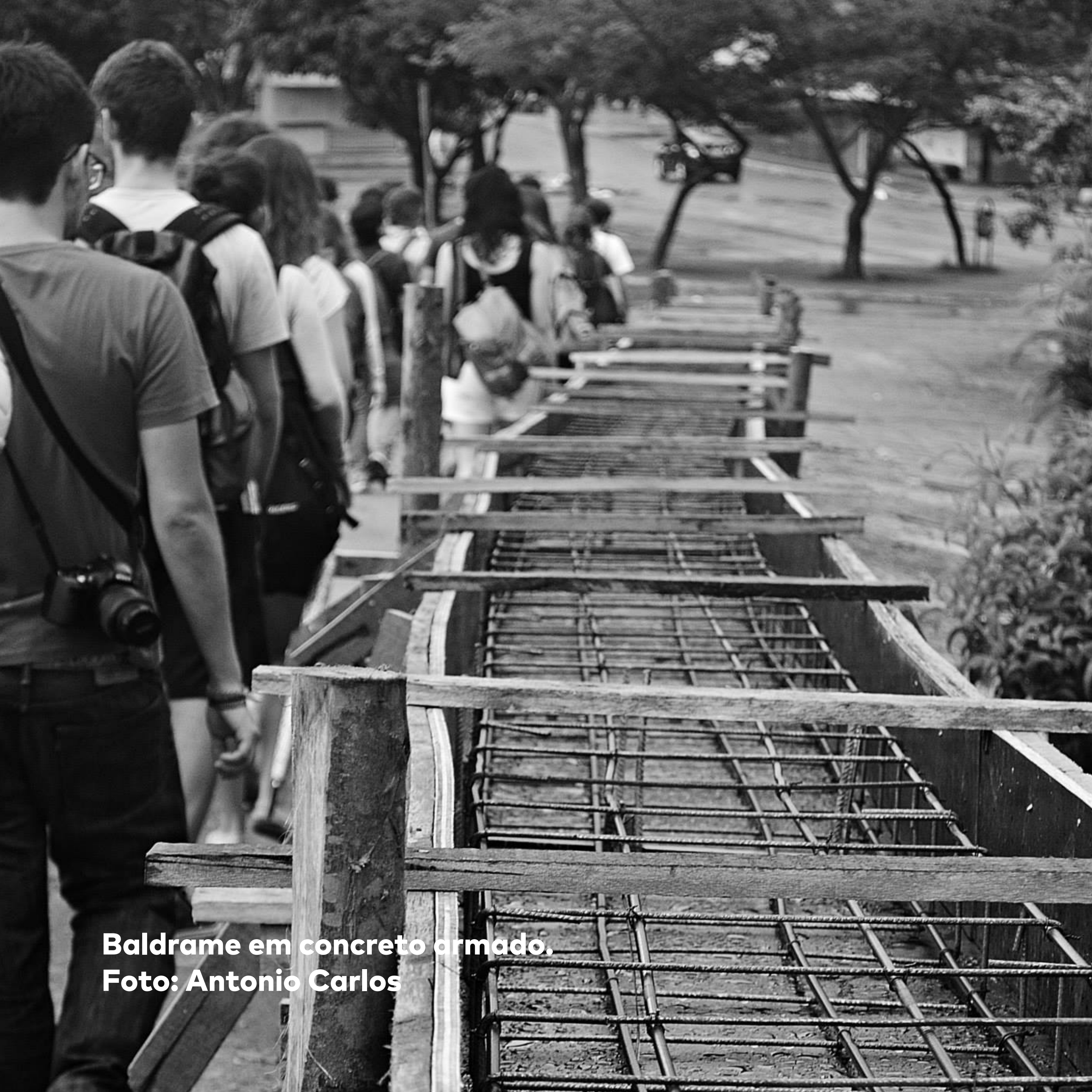
Baldrame em concreto armado.